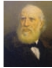
Isacco Pesaro Maurogonato