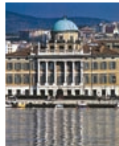
Generali Italia, Trieste

În ultimii ani, Generali Group a privit cu interes spre Orientul Îndepărtat, convins de perspectivele bune de dezvoltare ale acestei zone. Astfel, acesta și-a început activitatea în Filipine, Thailanda și a pătruns pe piața chineză și pe cea indiană. De asemenea, Grupul și-a consolidat poziția în America Latină, unde are o prezență prosperă.