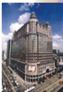
Generali Viață China Guangzhou