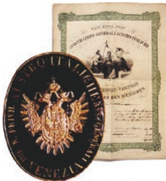
Una dintre cele mai vechi polițe de viață și placa inscripționată cu culturaul habsburgic

Au trebuit să treacă 50 de ani de la înființare, o jumătate de secol de muncă pentru ca Assicurazioni Generali să capete experiență, soliditate financiară și prezență internațională. Generali a cunoscut o schimbare prin înființarea unor noi subsidiare. Aceste companii, specializate pe sectoare sau piețe specifice, erau autonome la nivel operativ și managerial. Companiile înființate în acești ani au inclus Erste Allgemeine în Viena, companiile Anonima Grandine și Anonima Infortuni specializate pe asigurări de grindină și accidente în Milano și Concorde în Paris.