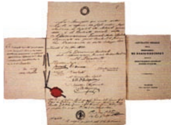
Statutul societății, semnat de acționari pe 16 februarie 1832

Pe 26 decembrie 1831, partenerii fondatori au semnat o convenție de asociere prin care se constituia „Assicurazioni Generali Austro-Italiche”. Omul din spatele acestei inițiative a fost Giuseppe Lazzaro Morpurgo, un om de afaceri fascinat de teoria și practica asigurărilor.