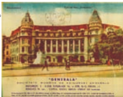
Sediul Generala, București 1934

Istoria Grupului Generali în România începe în anul 1835, odată cu înființarea primei sucursale în cel mai mare oraș comercial românesc al epocii, Brăila. Principalul obiect de activitate al companiei era asigurarea mărfurilor transportate. La data de 19 martie 1897, tot la Brăila, beneficiind și de capital românesc, prin participarea Băncii Marmorosch Blank&Co., se înființează Societatea Română de Asigurări Generale.