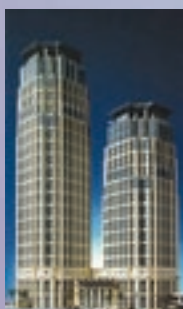
Sediul Generali Thailanda