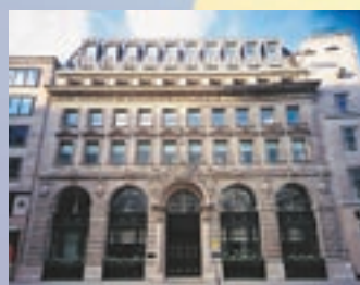
Generali Anglia, Londra